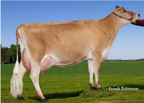
JX VIERRA ELSA {6}

JX OAK LANE EUSEBIO ERICA {5} VG-87%-4YR-USA